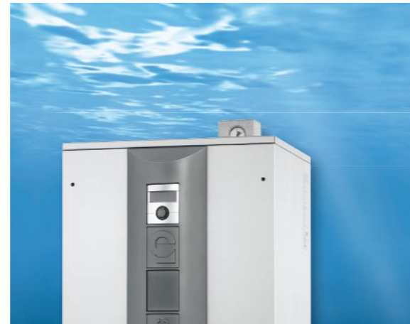
Wasser / Wasser-Wärmepumpe WWC 440

Durch die kompakte Bauweise von Alpha-InnoTec Wasser/Wasser-Wärmepumpen wird ein Minimum an Aufstellfläche benötigt. Der doppelte schwingungsgelagerte Geräteaufbau und die intelligente Schalldämmung gewährleisten eine äusserst leise Betriebsweise. So können die Wasser/Wasser-Wärmepumpen praktisch in jedem Keller- oder Abstellraum installiert werden.